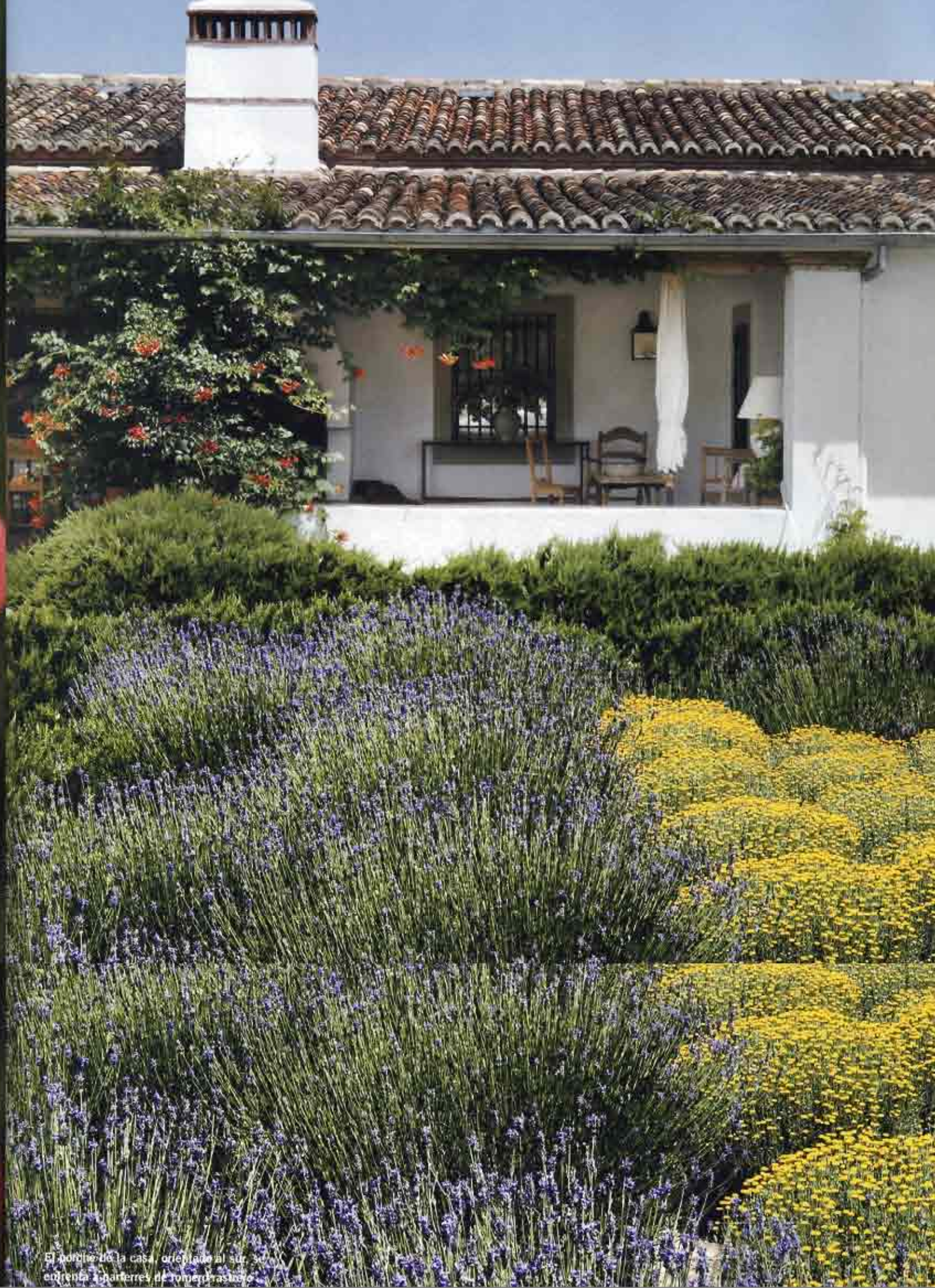
El porche de la casa, orientado al sur, enfrenta a parterres de romero y rasos.