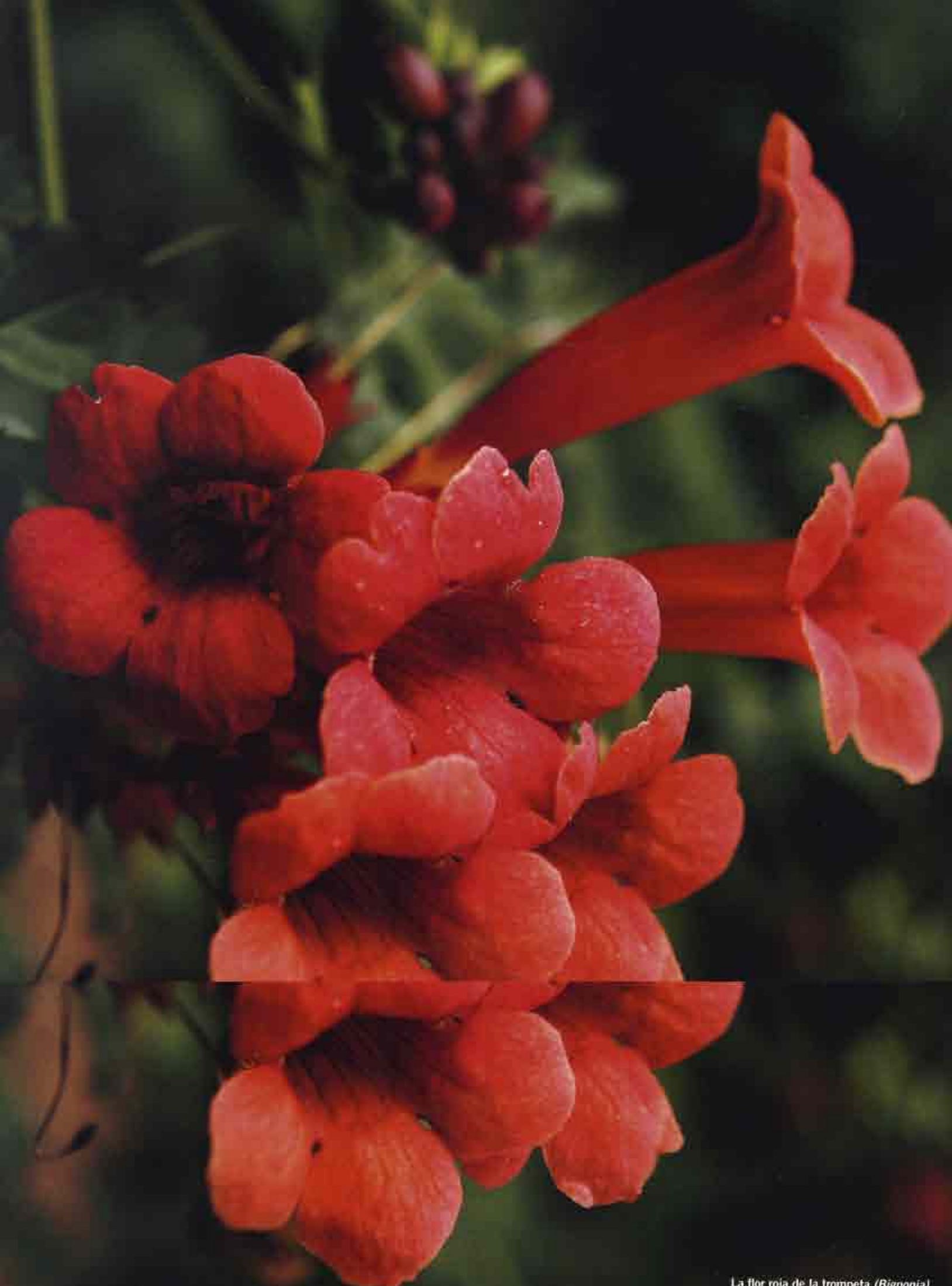
La flor roja de la trompeta ( Bignonia ) ofrece toda su espectacularidad